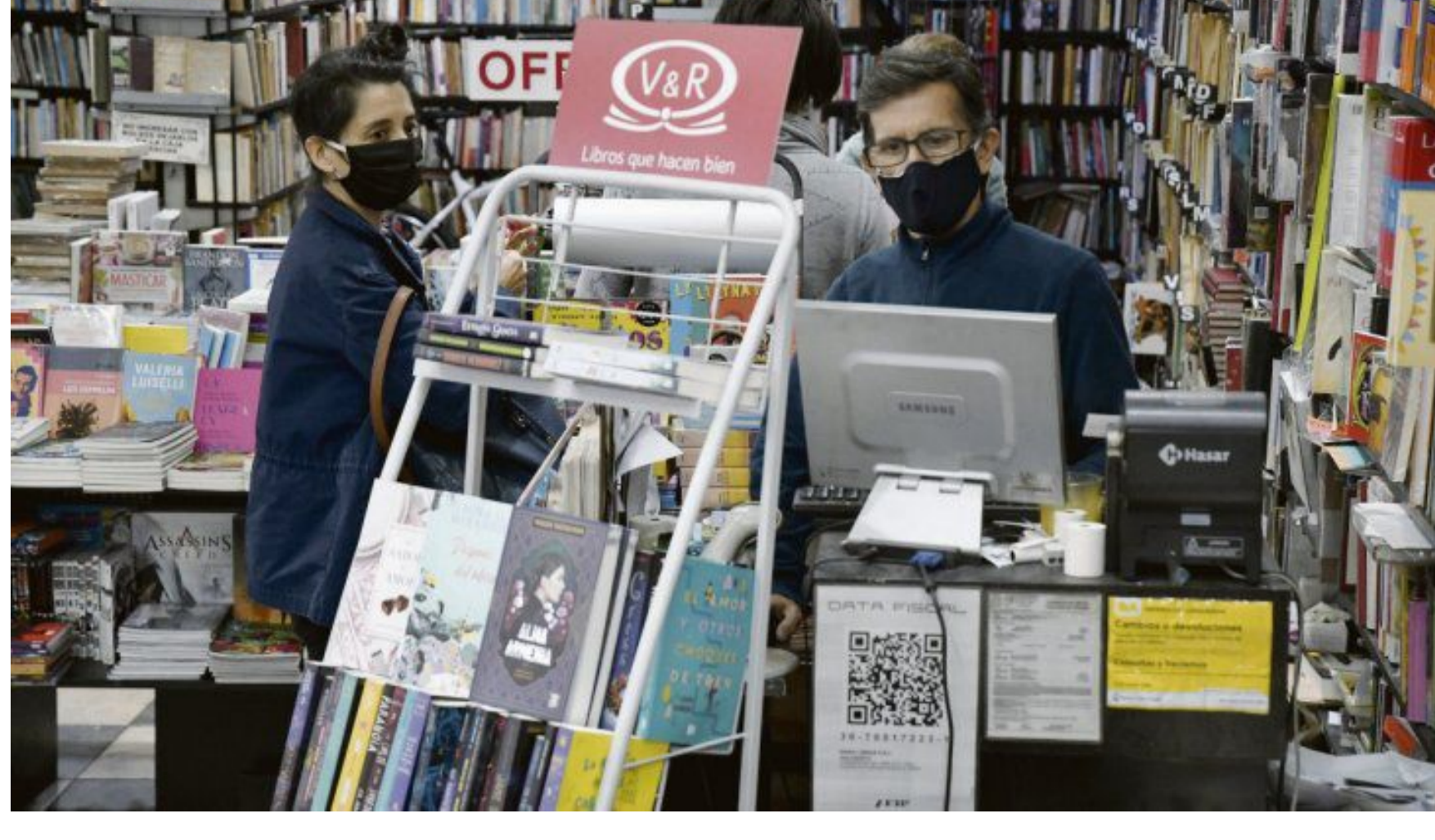
Hoy las librerías funcionan con horario reducido y permiten el ingreso de poca gente al negocio. Así todo quieren permanecer abiertas para estar cerca de los clientes.